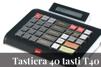
Tastiera 40 tasti T40